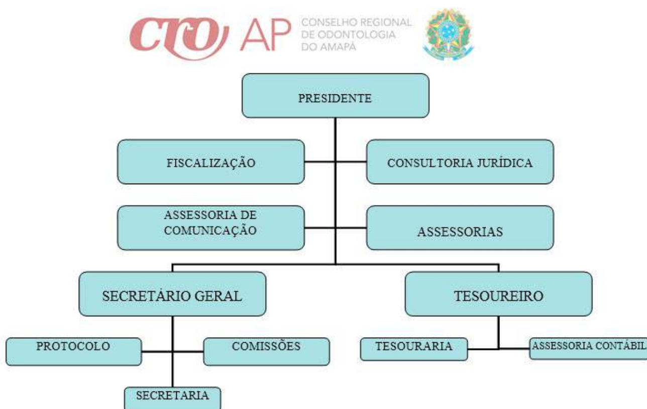
Organograma CRO/AP Organograma CRO/AP